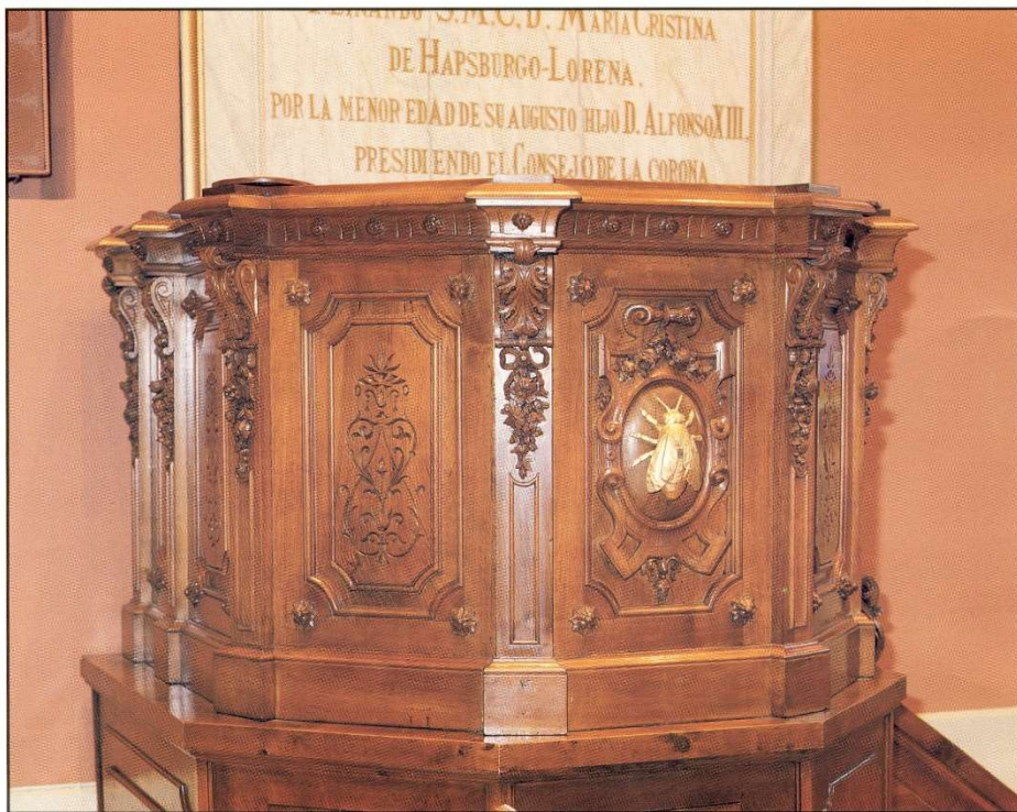
Cátedra del Paraninfo de la Universidad de Zaragoza